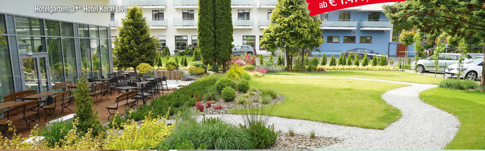
Hotelgarten, 3++ Hotel Koral Live