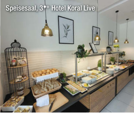
Speisesaal, 3++ Hotel Koral Live