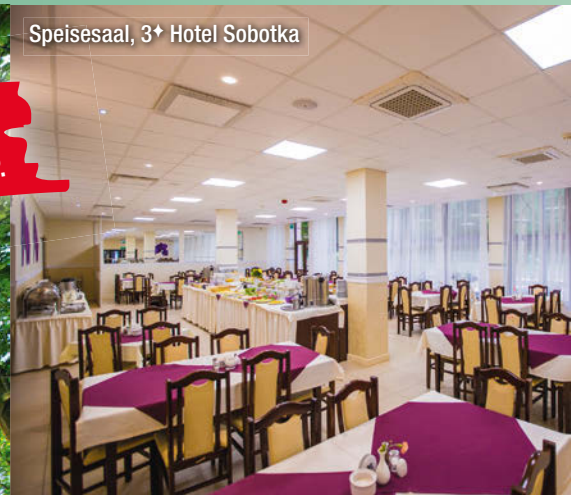
Speisesaal, 3+ Hotel Sobotka