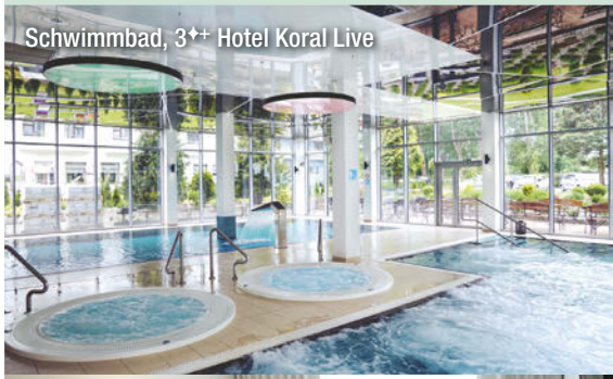
Schwimmbad, 3++ Hotel Koral Live

Freizeit/Kur/Unterhaltung: In der hoteleigenen Kur-Abteilung werden Ihnen hochwertige Kur-Anwendungen, wie Massagen, Packungen und Solebäder angeboten. Darüber hinaus verfügt das Hotel über ein Schwimmbad (16 x 6 m, ca. 32°C), Solebecken (12 x 6 m, ca. 30-32°C), zwei Whirlpools, Sauna, Infrarotsauna, Dampfbad und Fitnessraum. Die Café-Bar lädt Sie bei leckeren Getränkeangeboten (gg. Gebühr) und gelegentlichen Tanzabenden zum gelungenen Ausklang des Tages ein.