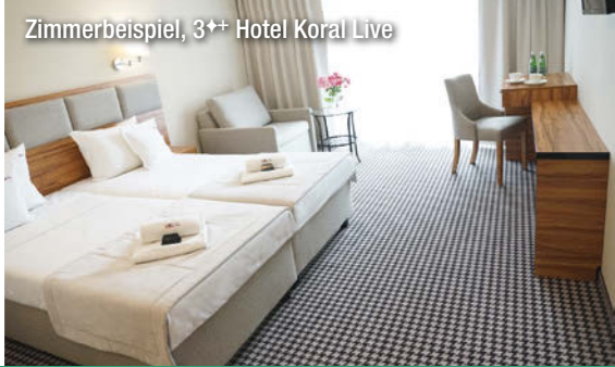
Zimmerbeispiel, 3++ Hotel Koral Live