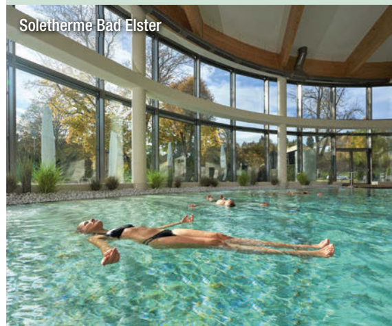
Soletherme Bad Elster