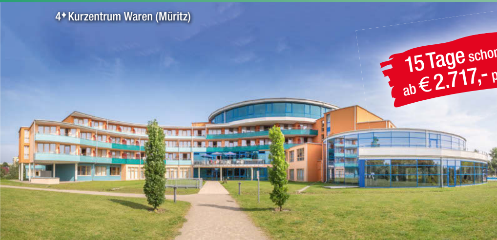
4+ Kurzentrum Waren (Müritz)