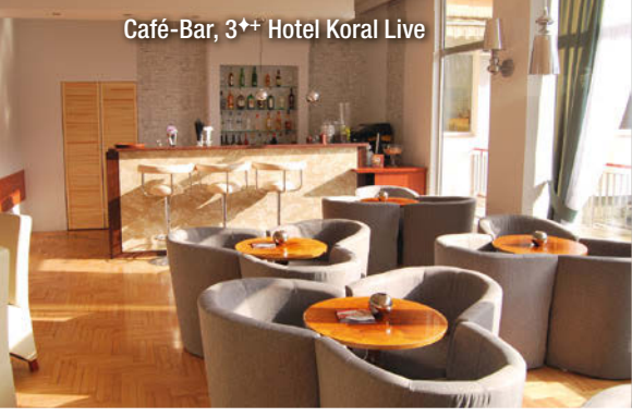
Café-Bar, 3++ Hotel Koral Live