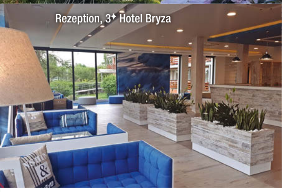
Rezeption, 3+ Hotel Bryza