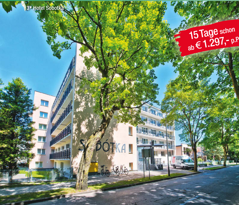
3+ Hotel Sobotka