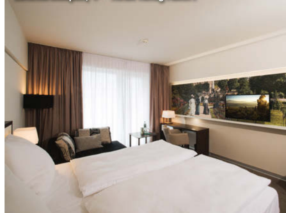
Zimmerbeispiel, 4++ Hotel König Albert