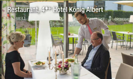
Restaurant, 4++ Hotel König Albert