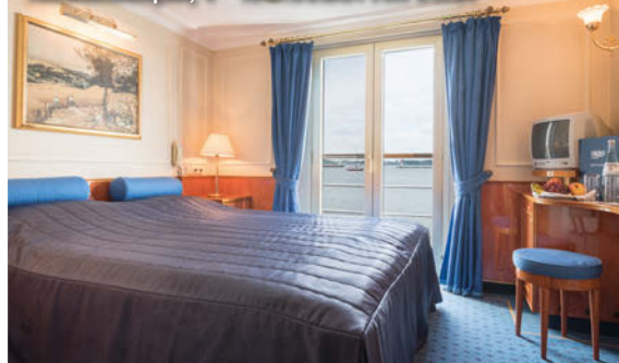
Kabinenbeispiel, 4++ KATHARINA VON BORA