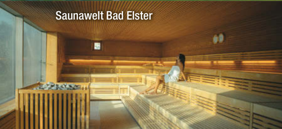
Saunawelt Bad Elster